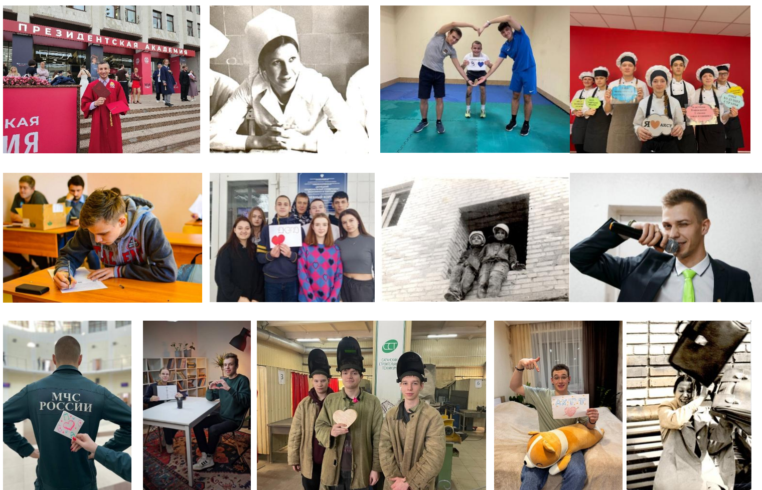
Фото и текст анонса Акции для соцсетей и каналов в мессенджерах с примерами фото и видео – по ссылке: https://disk.yandex.ru/d/QDUCToOxNDvCgg

Примеры фото (из студенческой жизни или для признаний в любви альма-матер):